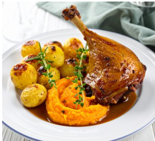
Cuisse de volaille confite au cidre et à l'estragon, purée de carottes et pommes grenailles rôties, jus de volaille