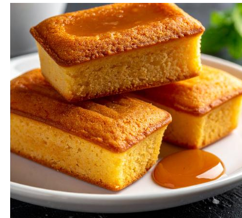
Financiers moelleux aux poires et lin, caramel au beurre salé