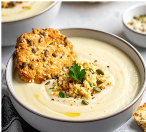
Crème Dubarry, croustillant au lin et chapelure à l'ail