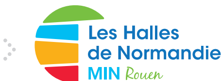
Plate-forme logistique agro-alimentaire de 20 ha, acteur incontournable de la région normande, le MIN de Rouen vous propose un accompagnement dans le développement de vos activités, à travers ses quelques locaux encore disponibles, et notamment :

📍 Le Petit-Quevilly ③ 8 000 m 2 38 €/m 2 /an Entrepôt d'environ 8 000 m 2 divisible à partir de 1 500 m 2 . Ponts roulants inférieur à 10 t. Portes sectionnelles. Belle hauteur. Possibilité de réaliser des bureaux et sanitaires.